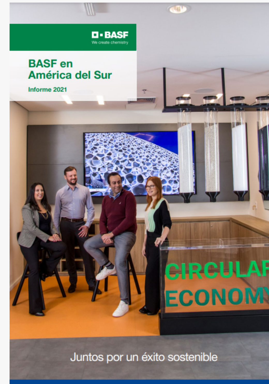
BASF Economía Circular (Archivo PDF para bajar)